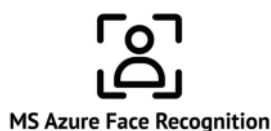
MS Azure Face Recognition

KI gehört zu den Top-Themen, insbesondere im Zeitalter der digitalen Transformation. Mit unserer Palette an attraktiven KI-Extensions steigern auch Sie Ihre Produktivität beim Arbeiten im CELUM ContentHub. Dazu nutzen wir die hervorragenden Funktionen der Microsoft Azure Cognitive Services .